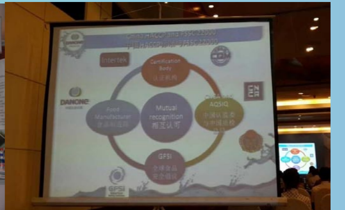
GFSI 全球食品安全倡议董事 & 达能集团质量总经理奕傅睿的演讲课件

全国 HACCP 应用与认证研讨会旨在落实质检总局“抓质量、保安全、促发展、强质检”的工作要求，发挥认证认可制度“传递信任、服务发展”的重要作用，帮助指导我国食品企业落实质量安全主体责任，强化食品安全风险意识，树立预防为主、系统管理的理念，探讨和解决在 HACCP 体系建立、实施、验证与认证过程中出现的新问题，进一步推动 HACCP 的应用，提高我国食品安全整体水平。